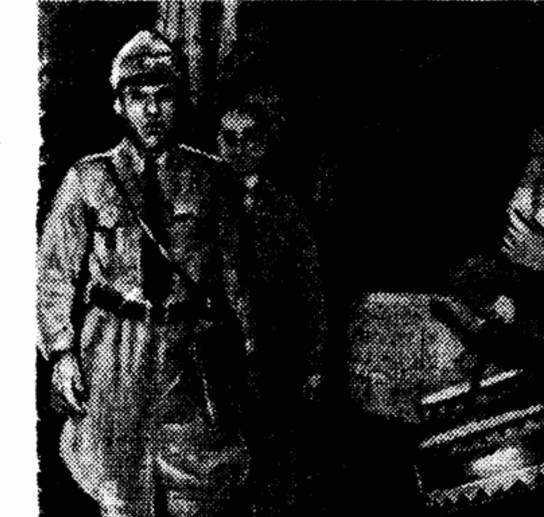
Снова маршируют по западным секторам Берлина недобитые гитлеровские молодчики — члены ревизионистской организации «Стальной шлем» (снимок слева). Они снова бьют в барабаны и призывают к походу на Восток. Полиция не препятствует их манифестациям.