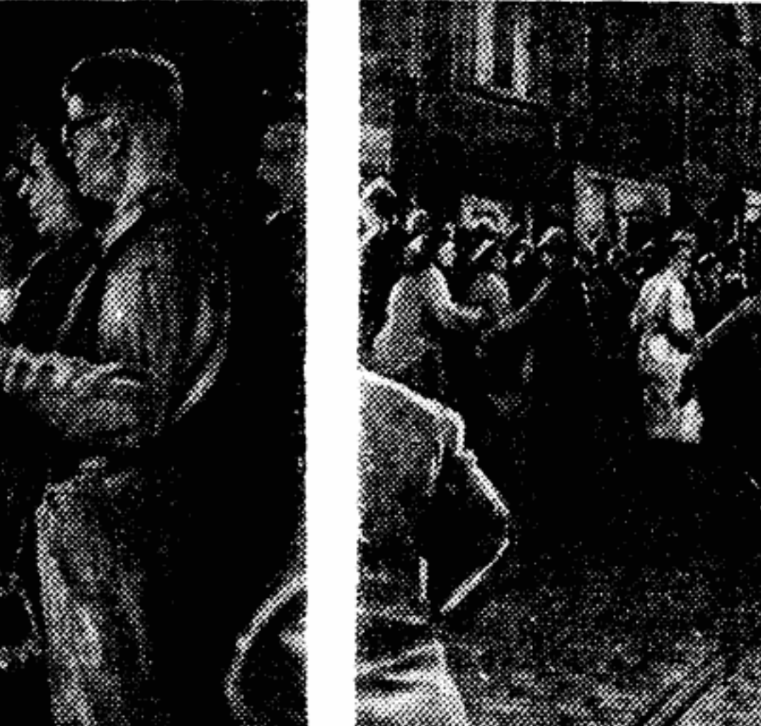
Зато «гардия дубинки» — так называют западноберлинскую полицию — избивает рабочих, протестующих против очередного «слеза» фашистских головорезов (снимок справа). Яркий пример западноберлинской «демократии».